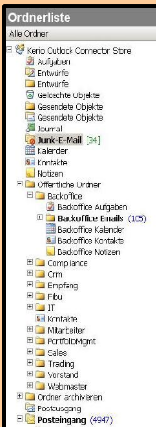
Öffentliche Ordner in Outlook

Unser Service rund um den Kerio-Server: Installation (gehostet, virtualisiert, auf eigener Hardware oder als Appliance), Migration, Wartung/Support, Admin-Einweisung – gerne stellen wir Ihnen eine Demo zur Verfügung.